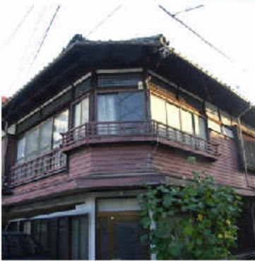
2階の窓辺の手摺が遊郭時代を 偲ばせる木造建築

今月の街あるきはかつての遊郭街～清川です。天神の南側に位置する清川は、博多区にあった遊郭（柳町）が、明治42年の九州帝国大学誘致でここに移転して以来、新柳町と名付けられて昭和33年の赤線廃止まで大変栄えたそうです。街を歩くと、いまでも遊郭時代の木造建築がいくつも残っていて、時代を感じさせてくれる界隈です。