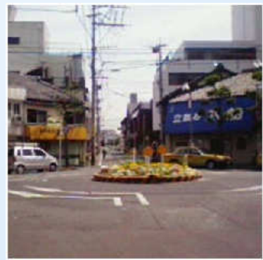
日本では珍しいラウンドアバウト と呼ばれる英国式のロータリー交差点

さて、この界隈、夜になるとちょっと暗くて怖いんですが、なかなか活めのお店がひっそりと営業中です。