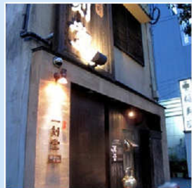
隠れ家っぽい雰囲気のお店構えが なかなかよろしい一刻堂の外観。