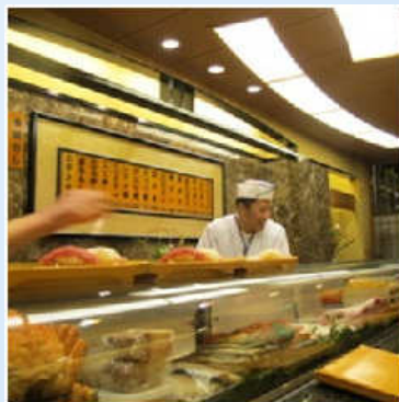
深夜も活気の長いカウンターが ある福寿司の店内。