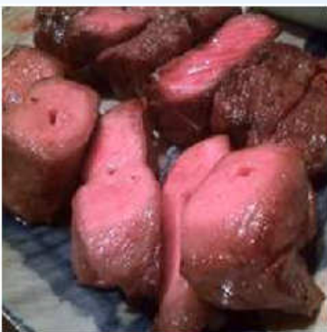
たんかの名物は牛さがり焼きと 牛たん焼き。大きな串で出てきます。