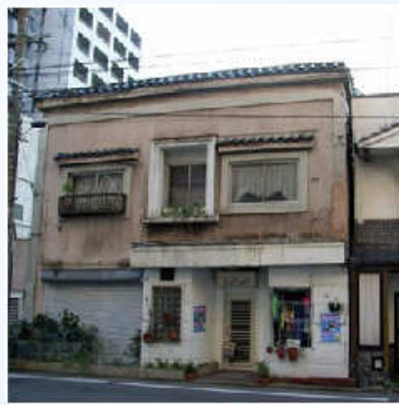
当時はカフェだったという 左官仕上げの窓のある建築